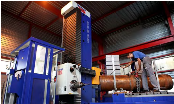
Aléseuse de grande dimension