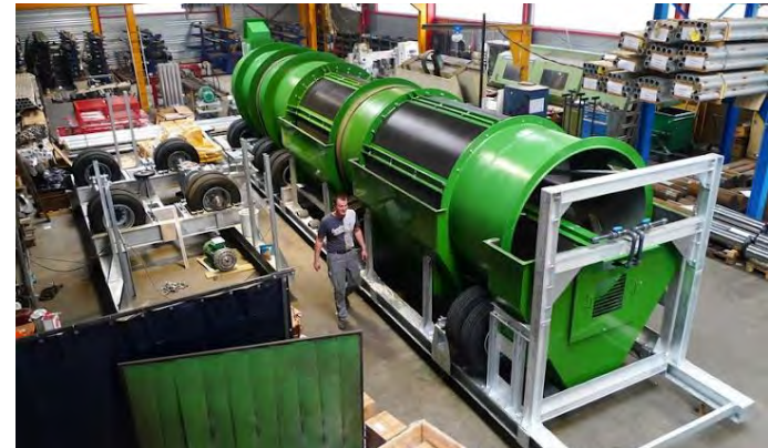
Tube-laveur Proceptis prêt à partir pour la Mongolie